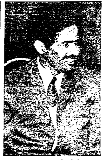
السيد السويدي وزير خارجية دولة الإمارات المتحدة

وقد استقبله الملك خالد بحضور لامين فهد ولي العهد والوزير سلطان وزير الدفاع والجنرال فيصل وزير الخارجية .